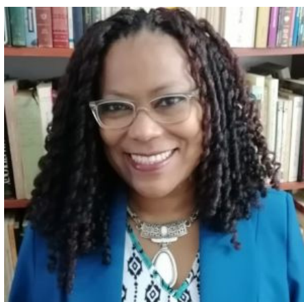
Nevis Balanta Colombia